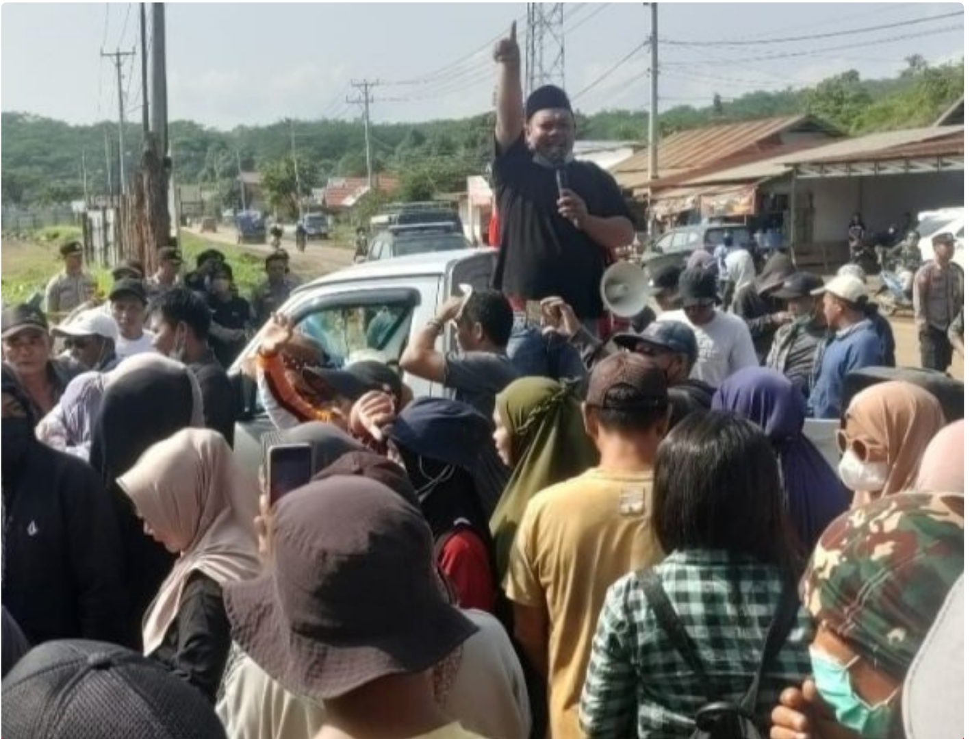
Tampak Korlap Aksi Demo Menyampaikan Orasinya di depan Kantor AFB Desa Lalampu

MOROWALI, Sulawesi Tengah- Tuntutan Aksi Demo yang dilakukan sejumlah warga Desa Lalampu masih menunggu keputusan dari PT Ang and Fang Brother (AFB) perusahaan tambang yang berlokasi di desa tersebut.