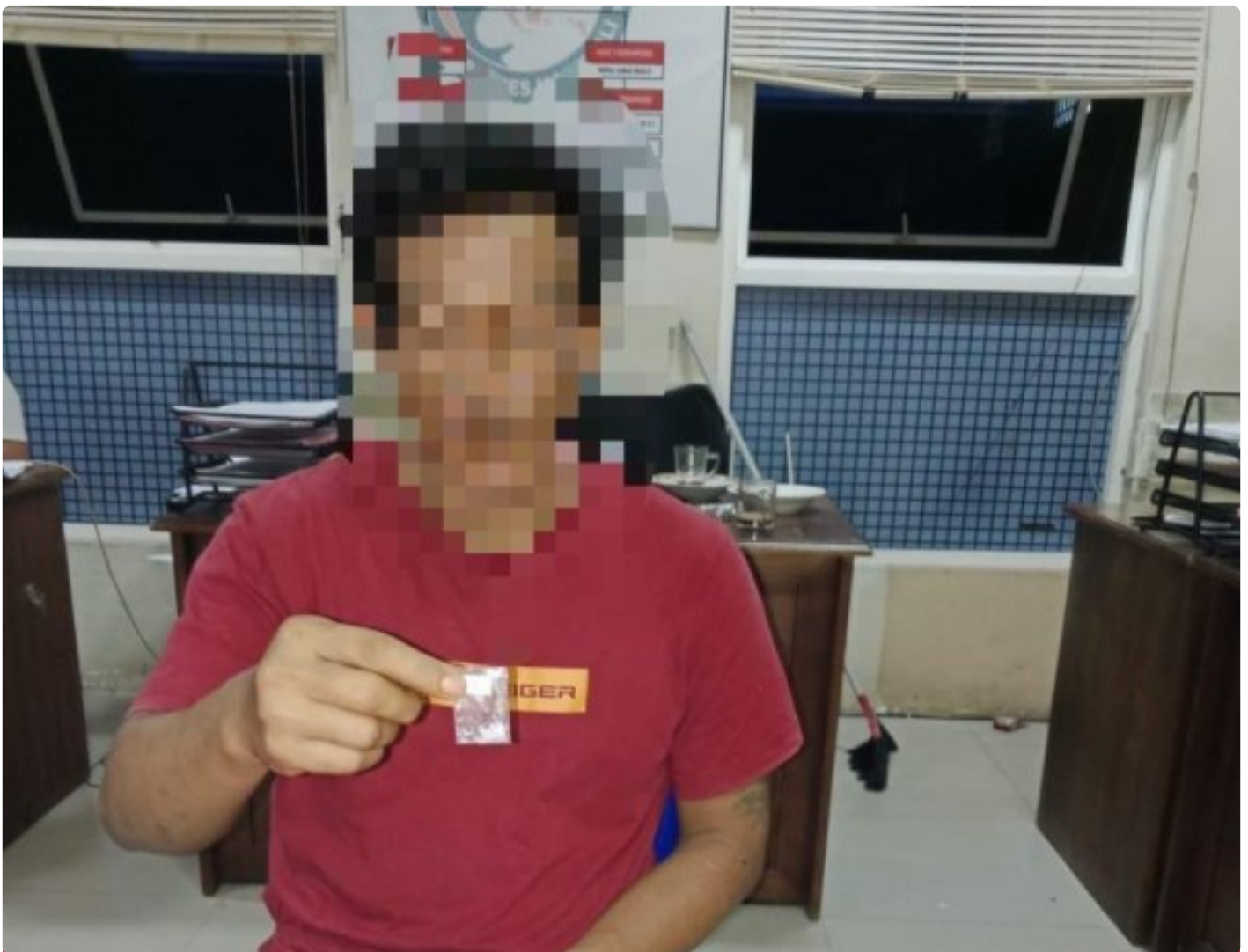
Pelaku terlibat Sabu terancam penjara seumur hidup

Morowali, 15 Januari 2025 – Polres Morowali berhasil mengungkap