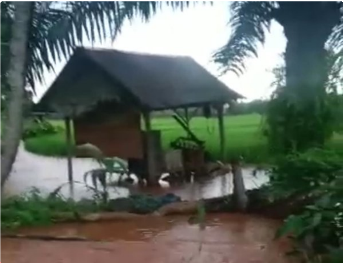
Tampak banjir lumpur berwarna kuning mengenangi area persawahan

MOROWALI, Sulawesi Tengah- Sangat memprihatinkan kondisi sawah petani warga Desa Solonsa Jaya yang saat ini tergenang banjir berwarna kuning diduga lumpur ore nikel akibat aktivitas perusahaan tambang yang ada disekitar Desa